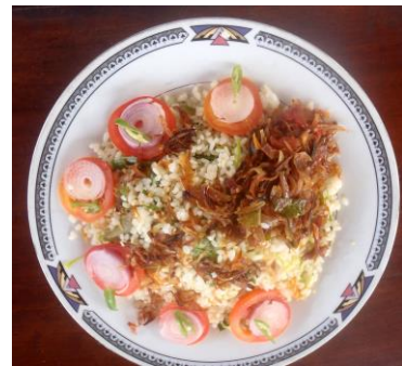
Een tros plantens – veel gegeten banane soort en een heerlijke Srilankaanse maaltijd