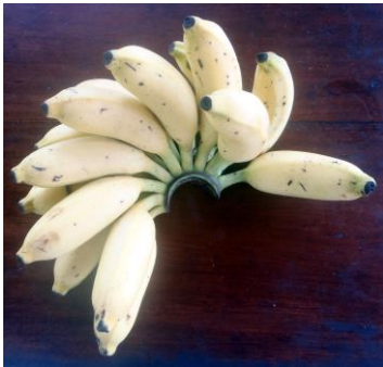
dit mag nog wel

we dat er best een betere bescherming kan zijn op dit gebied, maar de wet legt ook veel onderling contact aan banden en is in de praktijk eigenlijk niet handig. Maar we zijn er wel aan gehouden. Binnenkort staat de verklaring zoals wij die toepassen op de website, maar kortweg en in gewone taal komt het erop neer dat we uw namen en adressen voor niets anders gebruiken dan voor de contacten met u over zaken van A New Life, dat we ze nooit met derden delen en dat de administratie op een USB-stick wordt bewaard en dus niet op de harde schijf staat van een computer. We zullen uw toestemming vragen voor we uw naam of een foto waarop u herkenbaar te zien bent, publiceren en die toestemming kunt u dus ook weigeren. Overigens geldt dit alles niet voor de kinderen in Sri Lanka, maar ook daarmee zullen we – uiteraard - met zorg omgaan.